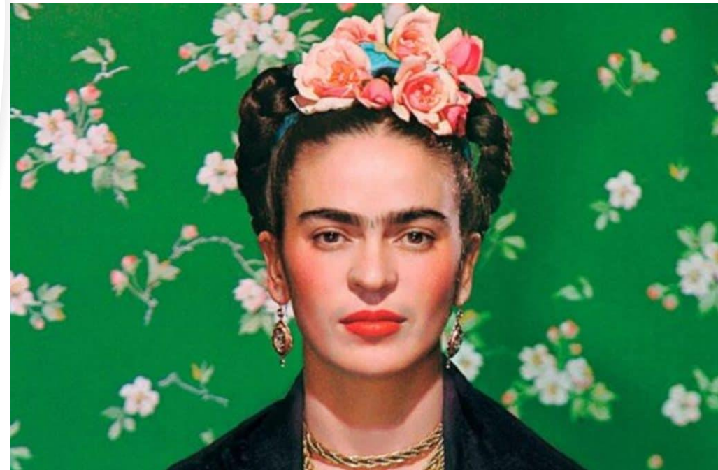
Frida Kahlo – artista mexicana