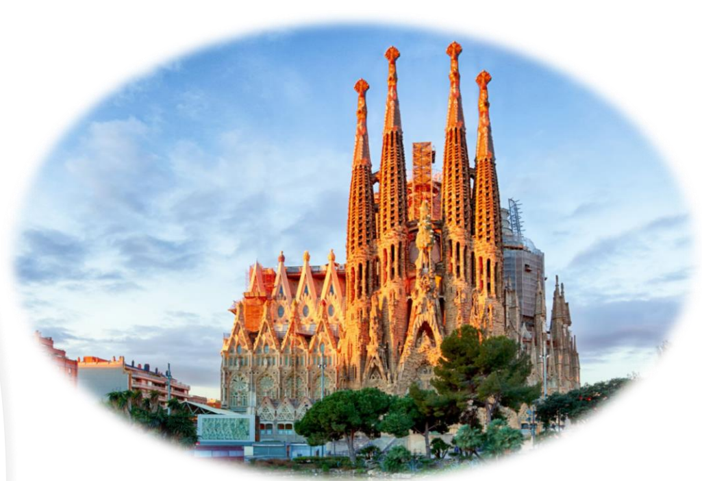
Sagrada Familia, Barcelona, España