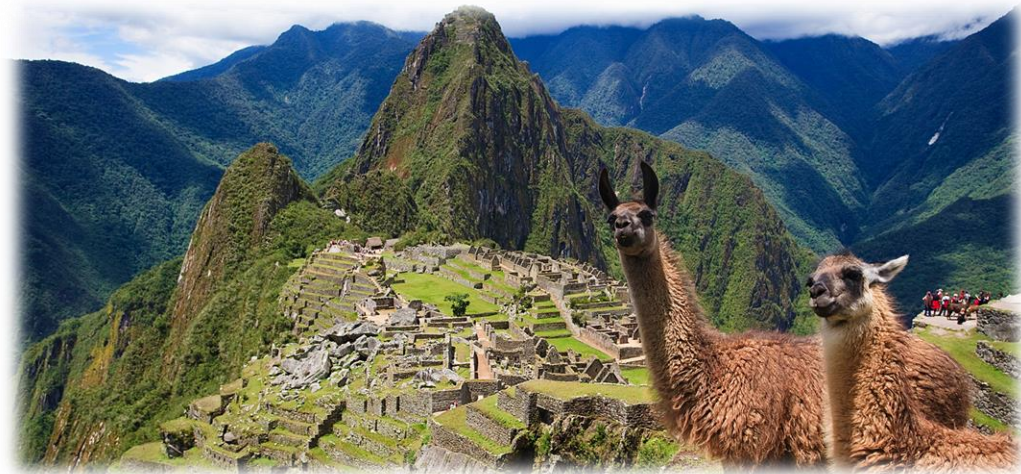
Machu Picchu, Perú